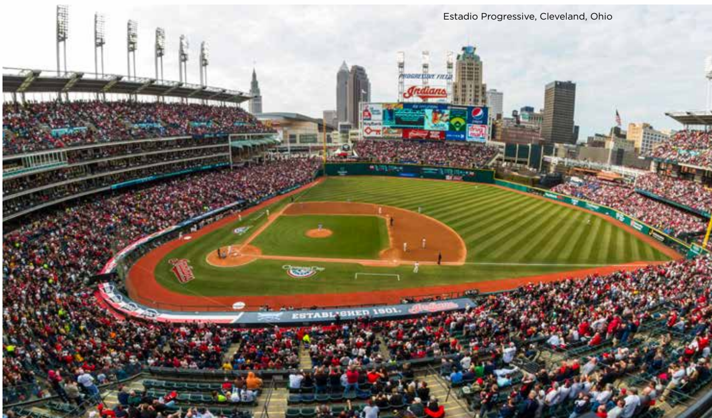
Estadio Progressive, Cleveland, Ohio