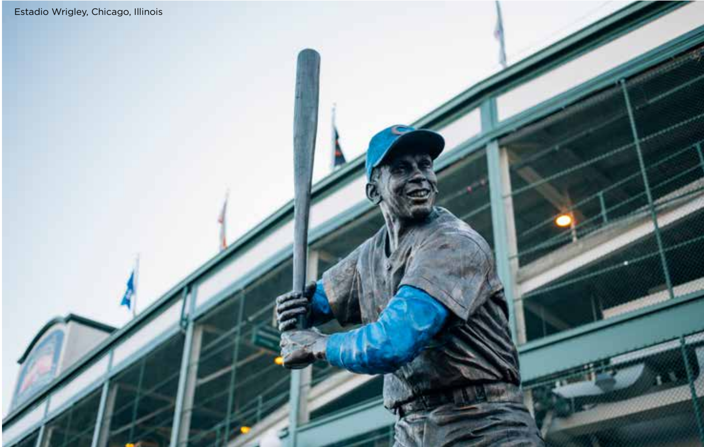
Estadio Wrigley, Chicago, Illinois