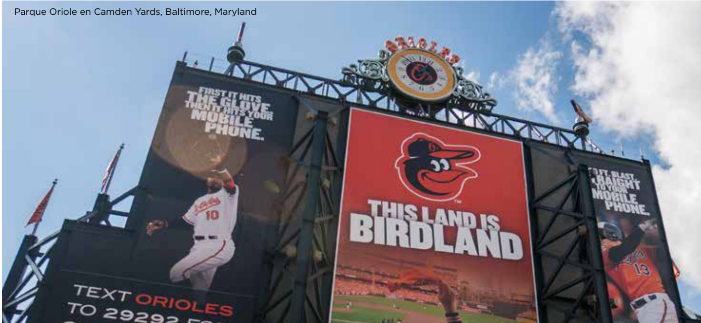
Parque Oriole en Camden Yards, Baltimore, Maryland