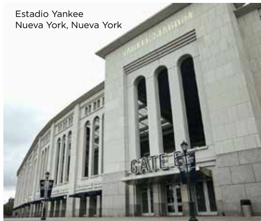
Estadio Yankee Nueva York, Nueva York

pelotas de béisbol, anillos de la Serie Mundial y mucho más de las leyendas Yankees del pasado y del presente. Si no puedes conseguir boletos para el juego, pero quieres experimentar la atmósfera, visita el Stan’s Sports Bar, que está cerca del estadio. En el corazón de Manhattan, visita la meca de los deportes y el entretenimiento, el Madison Square Garden. Disfruta de una verdadera experiencia en Nueva York en el nuevo recorrido con acceso completo por el Madison Square Garden. Es el hogar de algunos de los equipos profesionales favoritos de la ciudad, incluidos los New York Knicks del básquetbol y los New York Rangers del hockey, además de ser la sede para otros deportes como eventos ecuestres, boxeo y atletismo. Hospedaje: Nueva York, Nueva York