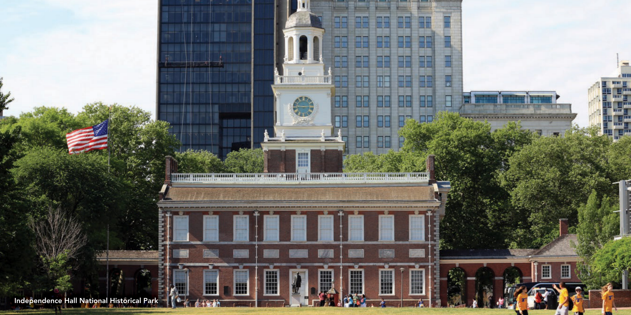
Independence Hall National Historical Park